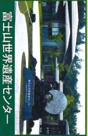
富士山世界遺産センター