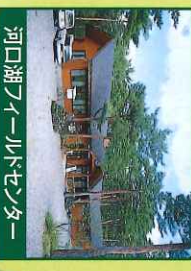
河口湖フナートセンター