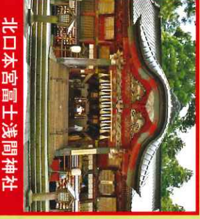
北口本宮富士浅間神社