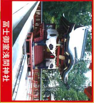
富士御室浅間神社