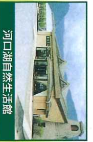
河口湖自然生活館